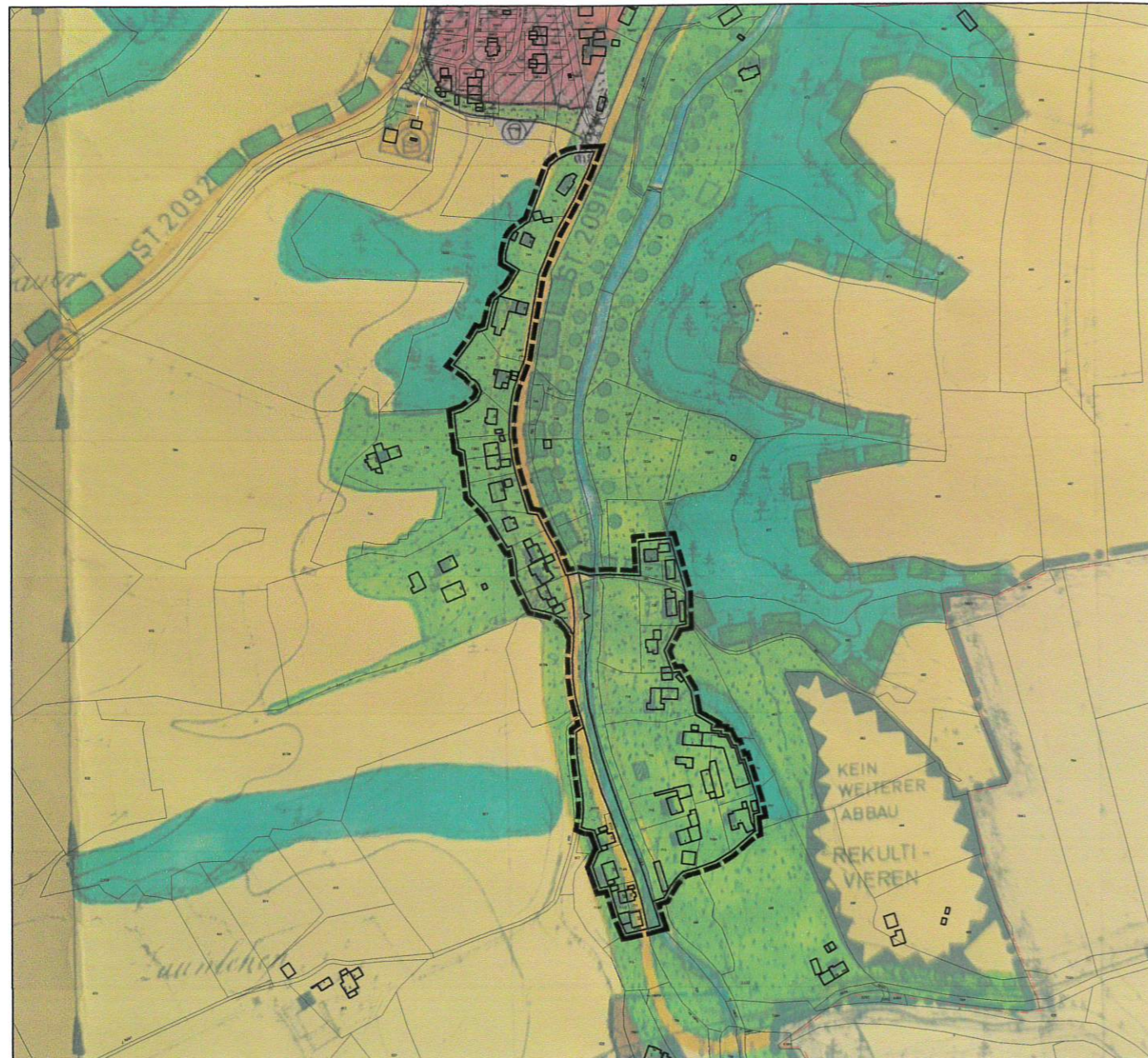
Legende Bestand (innerhalb des Geltungsbereichs)