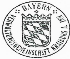
Jackl 1. Bürgermeisterin